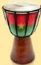
Duagadougou [Burkina Faso]