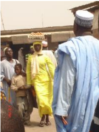
North of Cameroon. Going to the market.