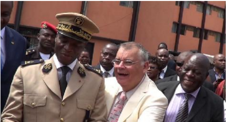
Gouverneur du Littoral, Douala, Kamerun & J-C Boand PDG ATYS ATS SA - Einweihung Sunwater Aktiv 2000 - November 2012