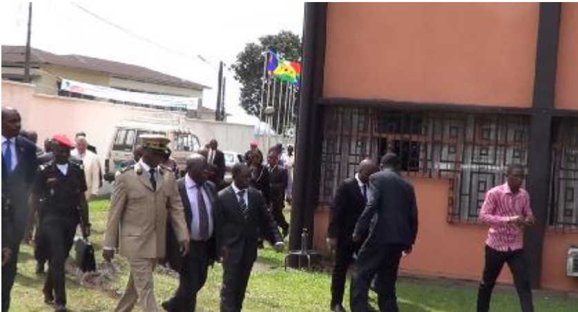
Douala - Cameroun – Inauguration officielle de la 1er installation Sunwater Activ 2000 – Novembre 2012