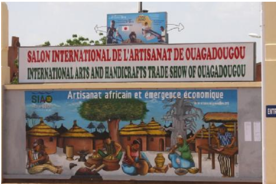
Image de la 13 ème édition du SIAO