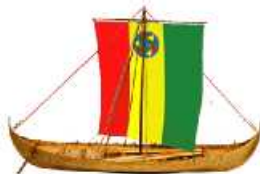
Guinea Fishing Boat