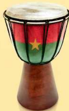
Ouagadougou [Burkina Faso]