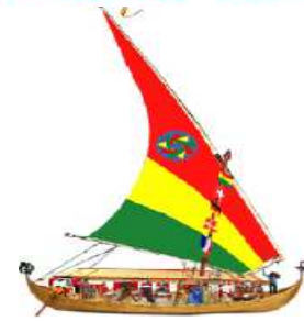
Guinea Touring Boat