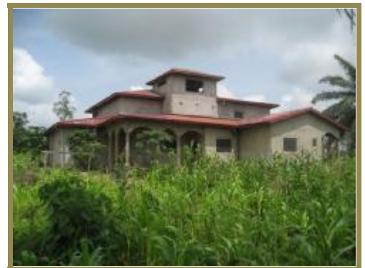
Douala – Yatchika projet AEPS création d'un centre d'accueil d'une école et jardin potager du

✓ Un coin compost pourrait être envisagé à l'ombre et ventilé, afin de recycler les déchets organiques.