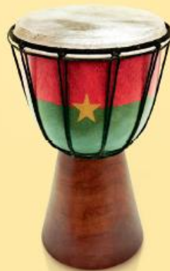
Ouagadougou (Burkina Faso)